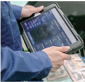
作業前に生産品目を登録 (QRコードなど)