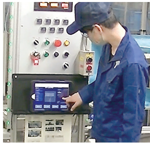
作業開始と作業終了を登録