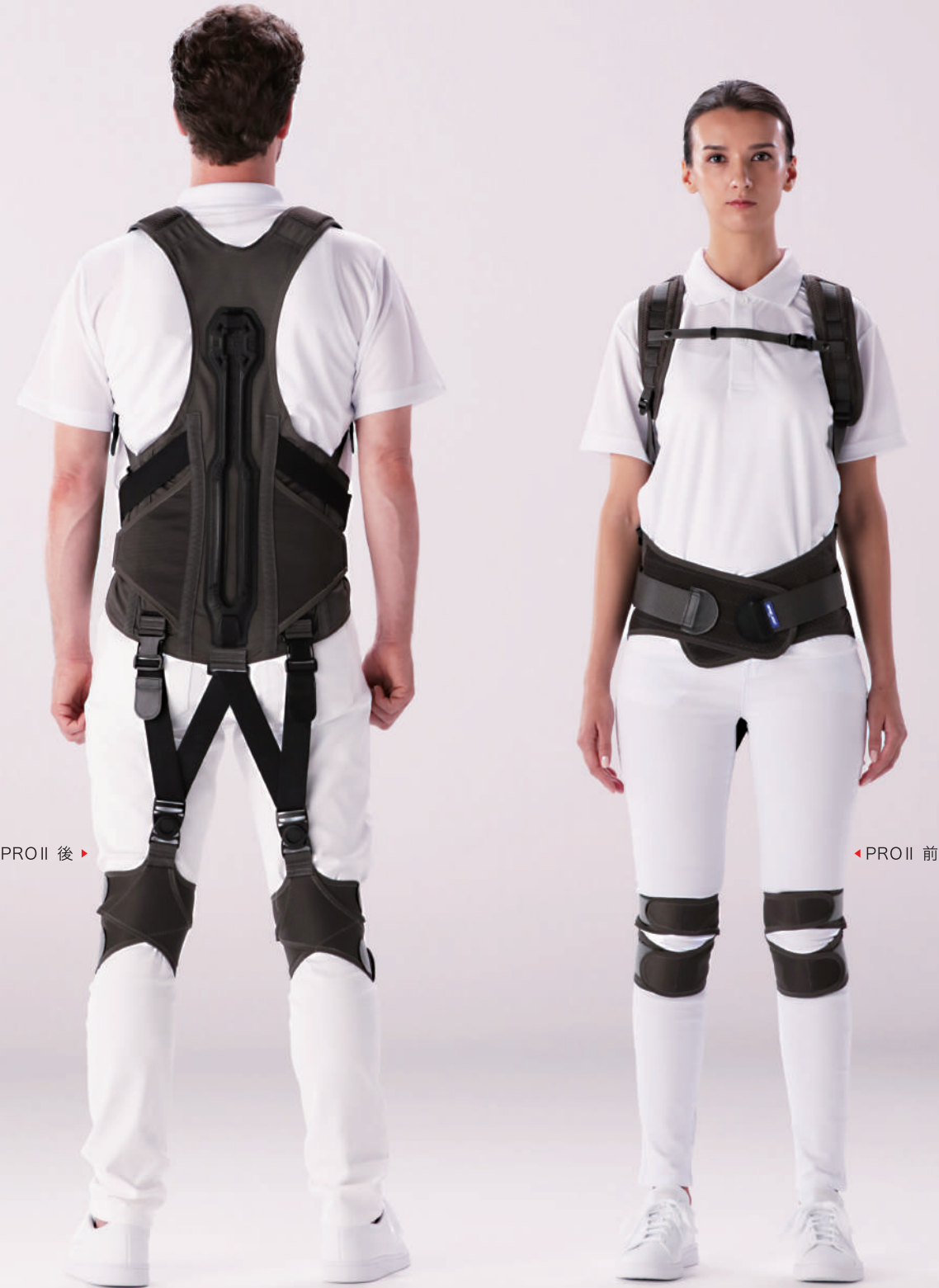
PRO II 後 ▶