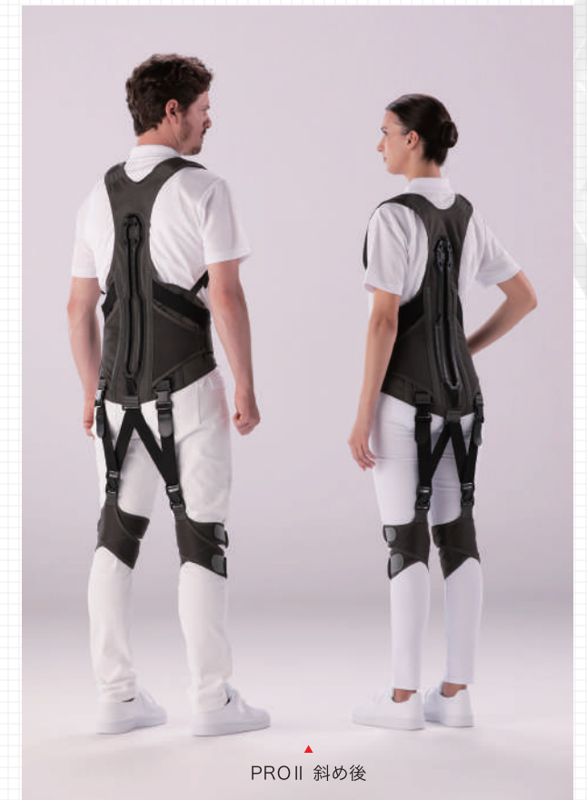
PRO II 斜め後