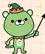
CELF イメージキャラクター ひよ〜とる