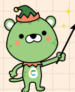
CELFF イメージキャラクター ひよ〜どる