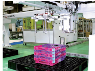
樹脂コンテナ搬送